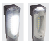
· 2 fuentes de luz.