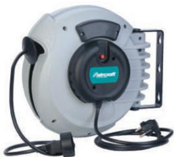
KAR PRO 18 - KAR PRO 25

Carcasa de plástico resistente a los impactos. El dispositivo de bloqueo se puede apagar. Con fuertes muelles de retroceso de acero especial. Retroceso particularmente uniforme y completo del cable eléctrico. Modelo con toma de tierra y caja de enchufe.