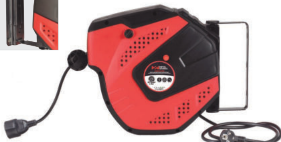
HAE31508N - HAE32508N - HAE31514N