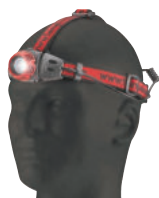
586A Modelo: encendido/reflejo/ encendido