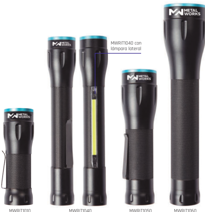
MWRIT1040 con lámpara lateral