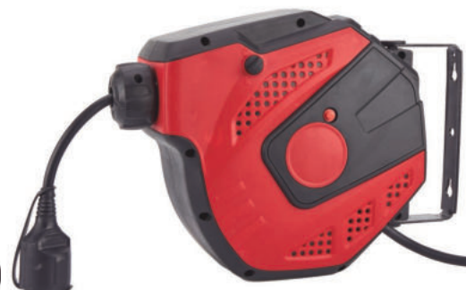
HAE31520N - HAE32520N