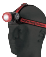
586C Modelo: alto/bajo/ encendido