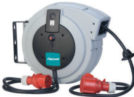
KAR PRO 10/5 - KAR PRO 20/5